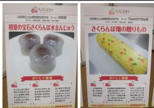
プレゼンテーションで使用した 作品紹介用ポスターパネル

県知事と山形市長をはじめとする審査員の方々の前でのプレゼンテーションでは、ポイントをしっかりと伝え、質問にも得意即妙に回答することができました。作品の完成度の高さもあり、大好評を得ての受賞となりました。